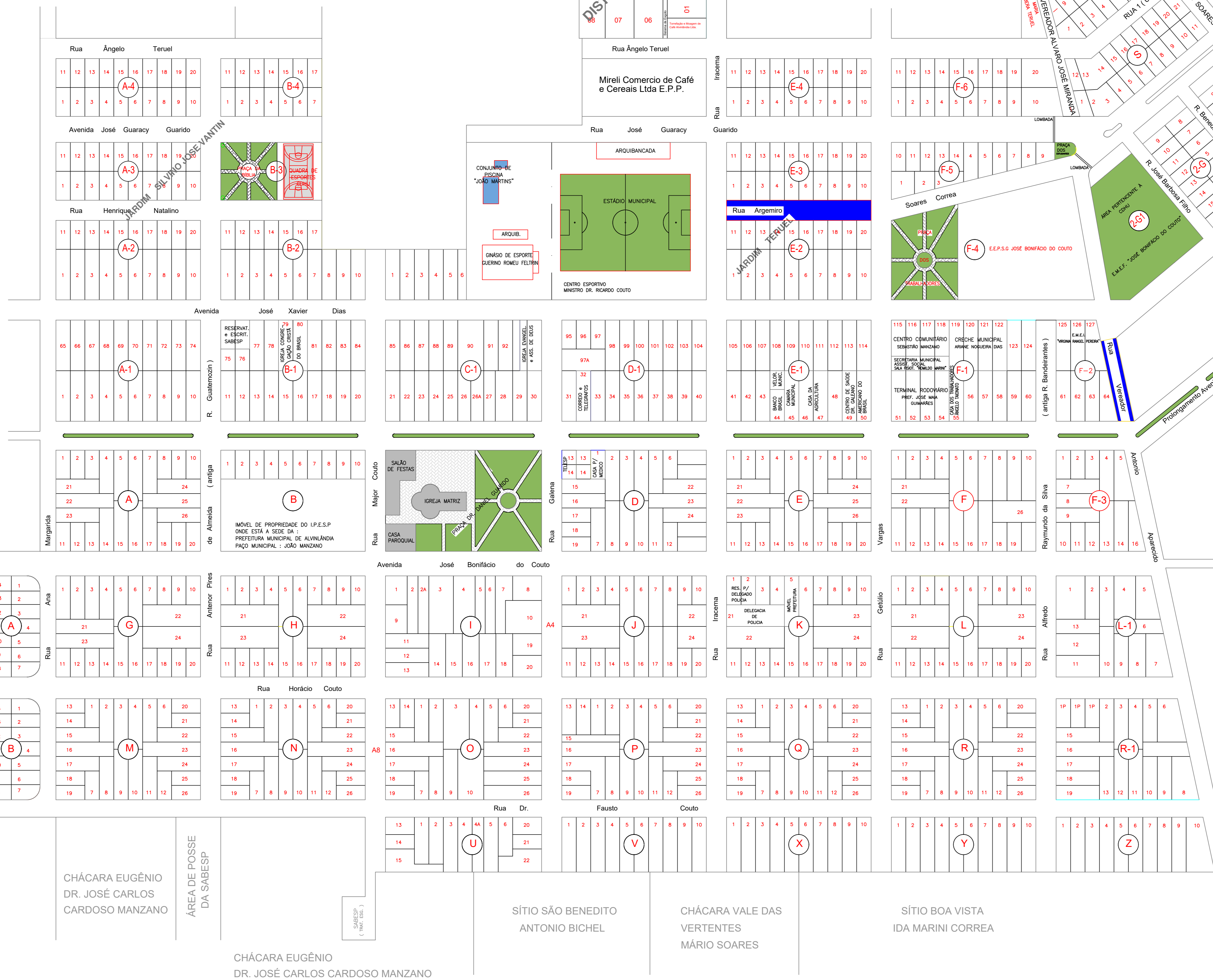
Detalhe 01 - Recapeamento Asfáltico (CBUQ)