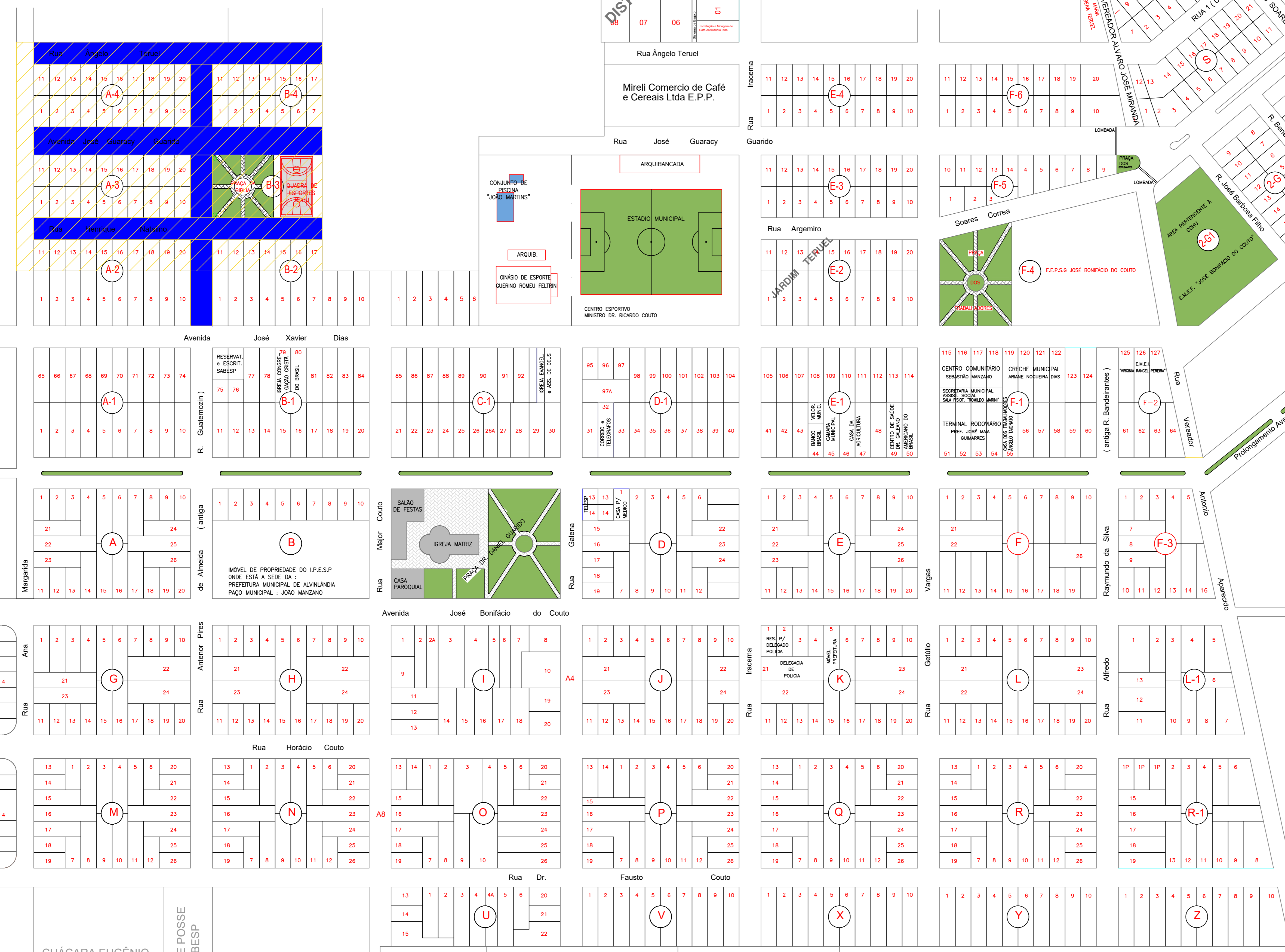
Detalhe 01 - Recapeamento Asfáltico (CBUQ)